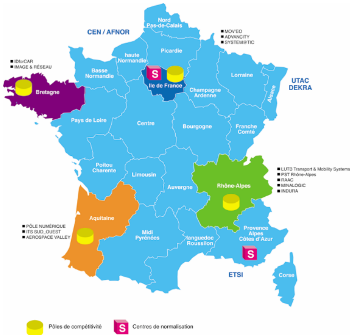
Fig. 3 – Carte des acteurs publics les plus actifs dans les ITS (septembre 2017)

Au niveau national, les actions publiques de développement des ITS se concentrent autour de quatre régions très actives (fig. 3). Les acteurs se partagent entre académiques, instituts de recherche, pôles de compétitivité, centres de certification, etc.